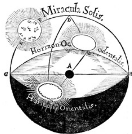
In Scheiners Disquisitiones von 1614 findet sich auf Seite 65 diese Abbildung, die die Sonne beim Auf- und Untergang in ovaler Form zeigt; Bayerische Staatsbibliothek, München, 4 Diss. 3499,12

Es zeigt sich u.a., dass Galileis späterer Vorwurf, Marius würde den Leser über die Verwendung des julianischen Kalenders im Unklaren lassen, ins Leere läuft, da er konsequent alle Termine julianisch und gregorianisch angibt.