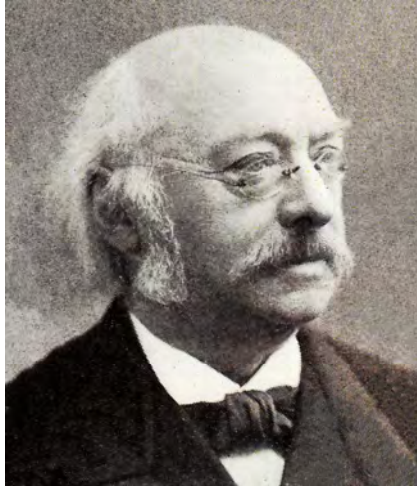
Bild 4. Johannes Bosscha im Jahr 1911; Foto: nvt (Prins der Geillustreerde Bladen) via Wikimedia Commons.

werden muß 48 und damit ein Effekt aus der Beleuchtung durch die Sonne und der Rückstrahlung von Jupiter ist. Marius macht auch darauf aufmerksam, dass – würde Galileis Annahme eines Dunstes um Jupiter stimmen – man „den vierten Mond niemals nahe beim Jupiter in Erdferne sehen“ 49 könnte, während er doch am schwächsten bei größter Elongation ist.