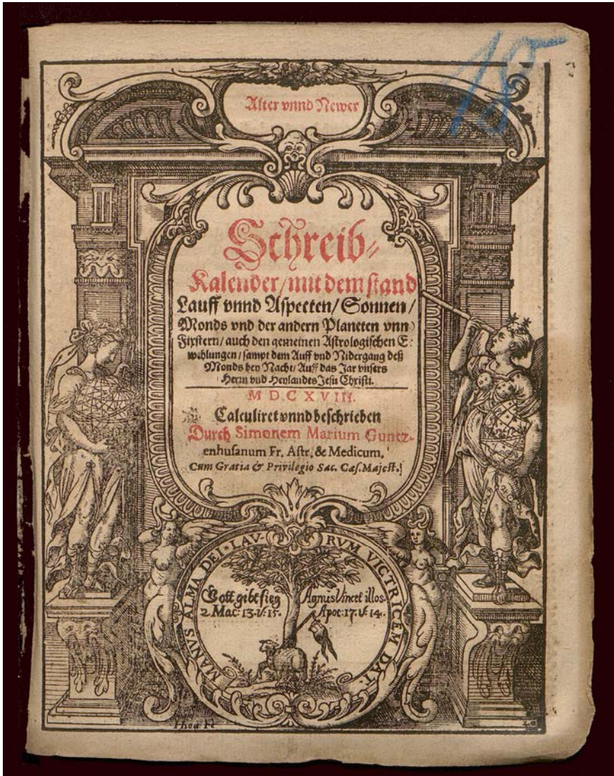
Bild 5. Titelblatt des Kalenders für 1618 (Staatsarchiv Nürnberg: Fürstentum Brandenburg-Ansbach, Staats- und Schreibkalender (129), Nr. 274, 18. Stück)