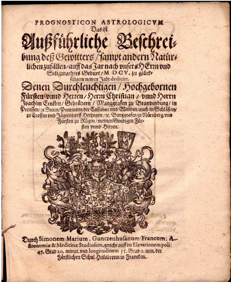
Bild 17. Titelblatt der Prognostik für 1605 (Staatsarchiv Nürnberg; Fürstentum Brandenburg-Ansbach, Staats- und Schreibkalender (129), Nr. 285)