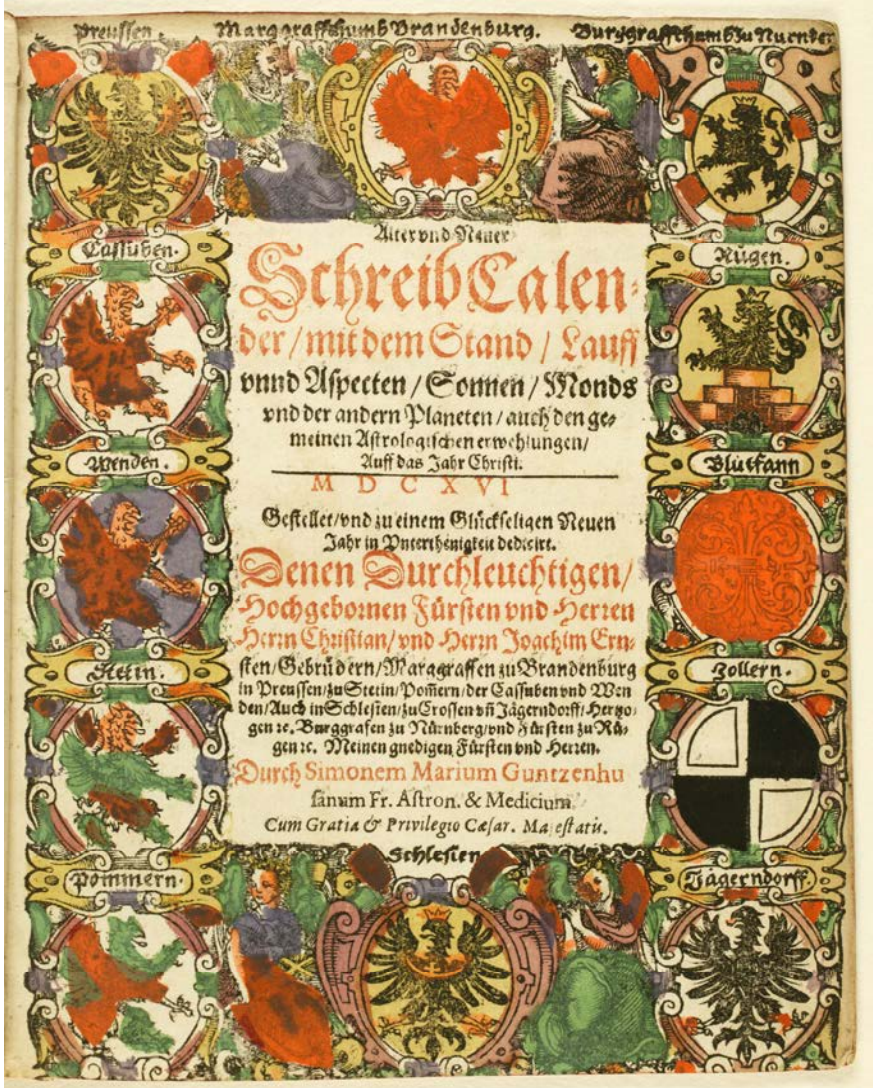
Bild 4. Titelblatt des Kalenders für 1616 (StB Nürnberg: Amb. 4. 261 (3))