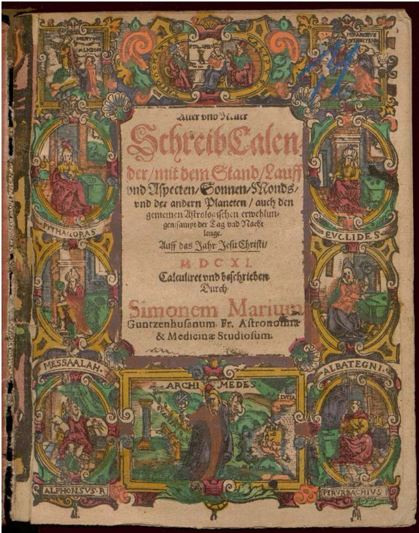
Bild 2. Titelblatt des Kalenders für 1611 (Staatsarchiv Nürnberg: Fürstentum Brandenburg-Ansbach, Staats- und Schreibkalender (129), Nr. 274, 11. Stück). Vgl. die Abbildung in Lerch 2015, S. 167: Josephus Scala, Ephemerides. Venedig 1589.