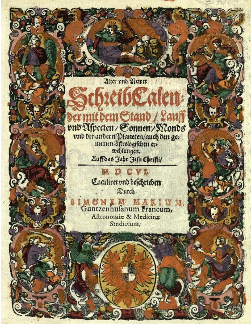
Bild 3. Titelblatt des Kalenders für 1606 (UB Augsburg: 02/IV.5.4.15)