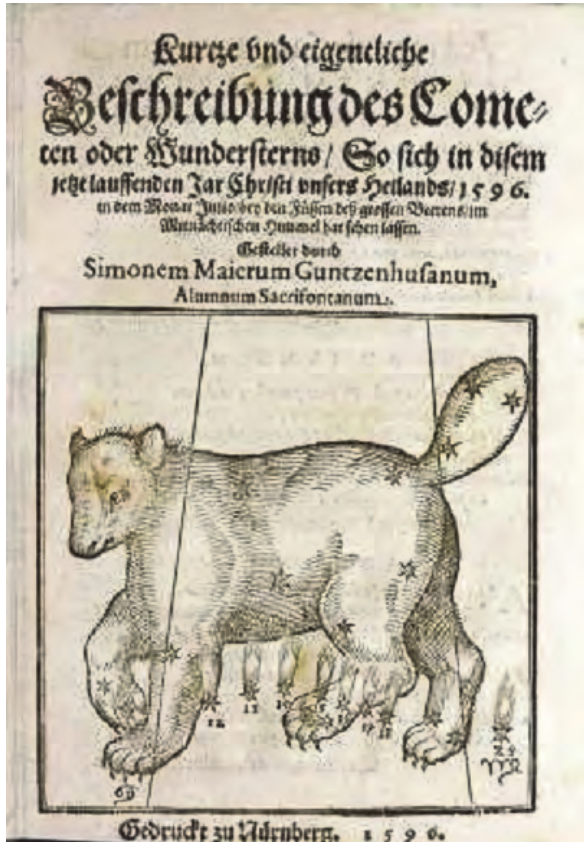
Bild 2. Titelseite der Schrift zum Kometen von 1596 von Simon Marius [1]

Planeten zu suchen sein. Marius findet, dass der Komet „inn den letzten 10. graden des Krebs entzündet worden.“ 7 „Daher hat ich einen argwohn geschöpfft / es würde die vrsach dises Cometen auch an disem ort verborgen ligen.“ 8