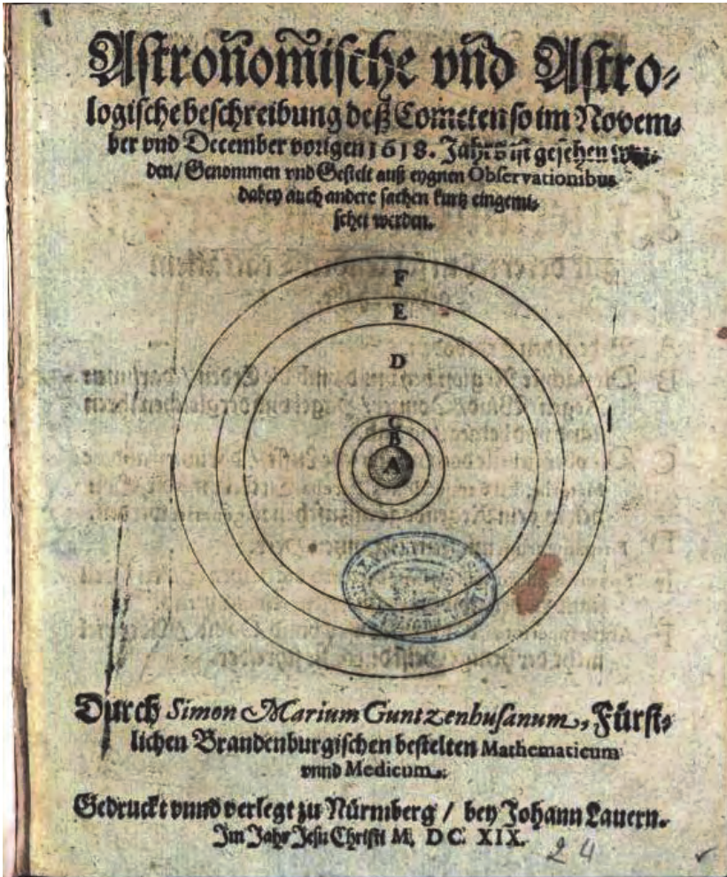
Bild 3. Titelseite der Kometenschrift von 1619 von Simon Marius [5]

großer Offenheit. Ist er 1596 mit einer eigenen Meinung zur Natur der Kometen zurückhaltend und scheint auch auf keine so richtig zuverlässigen Beobachtungen verweisen zu können, sieht nun alles ganz anders aus. Von den Grundlagen der Kometenphysik auf dem Boden der Physik des Aristoteles distanziert sich Marius gleich eingangs seines Berichtes: 28