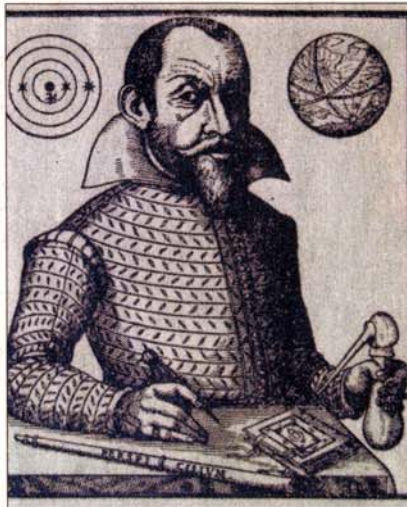
Simon Marius war einst als Astronom am Ansbacher Hof beschäftigt.