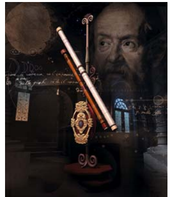
Galileo Galilei 1564-1642