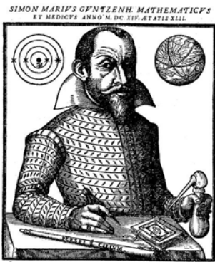
Simon Marius 1573-1625